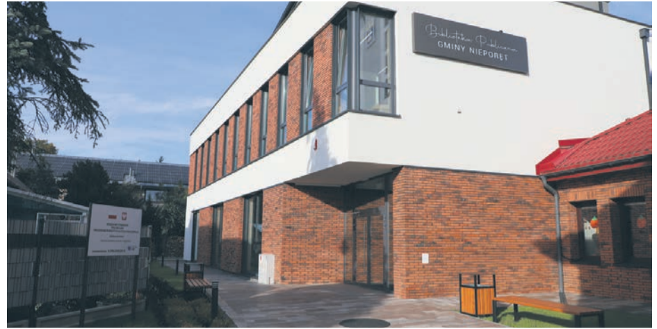
Biblioteka Publiczna Gminy Nieporęt