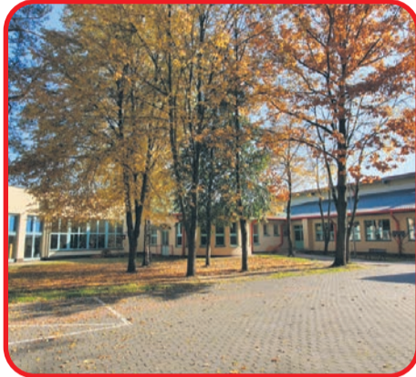
Szkoła w Izabelinie