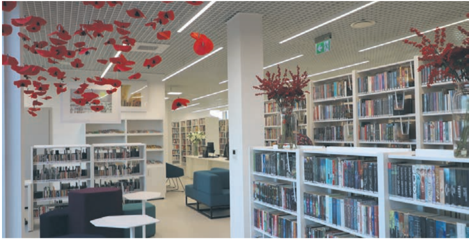
Biblioteka Publiczna Gminy Nieporęt