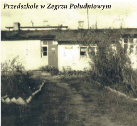
Przedszkole w Zegrzu Południowym