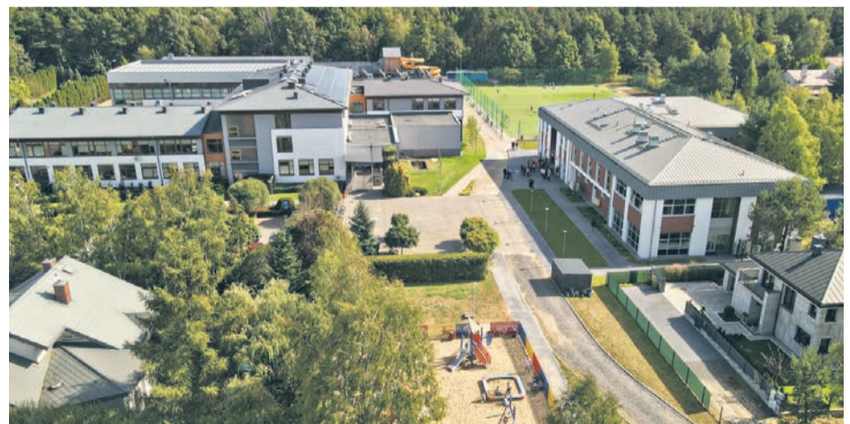
Szkoła Podstawowa i Liceum Ogólnokształcące w Stanisławowie Pierwszym