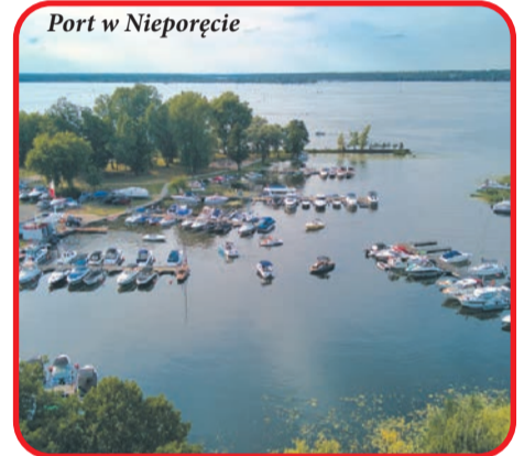
Port w Nieporętcie