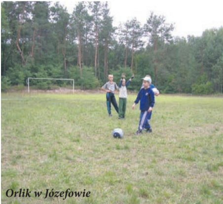
Orlik w Józefowie