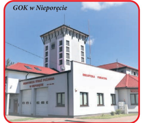
GOK w Nieporętcie