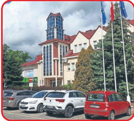
Filia GOK w Stanisławowie Drugim