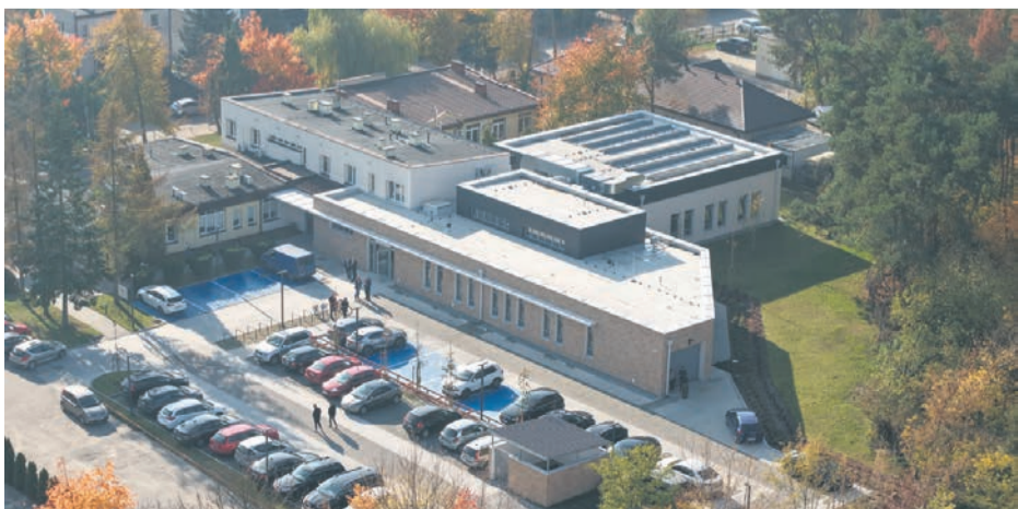
Przychodnia rehabilitacji przy Centrum Medycznym Nieporęt