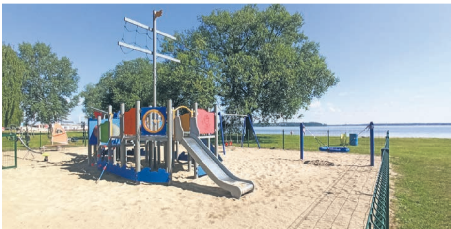
Plac zabaw na Dzikiej Plaży