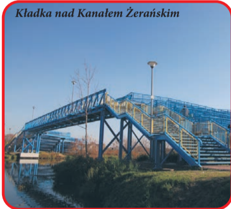
Kładka nad Kanałem Żerańskim