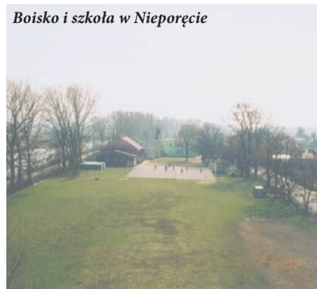
Boisko i szkoła w Nieporętcie