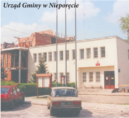
Urząd Gminy w Nieporętcie